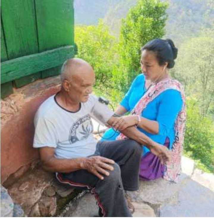
जेष्ठ नागरिक स्वास्थ्य परिक्षण कार्यक्रम @ दुदिलाभाटी स्वास्थ्य चौकी, बागलुङ

अंक १९७, वर्ष ६, २०८१ असार २, June 16, 2024 आइतबार