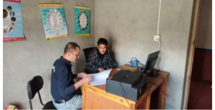
स्वास्थ्य निर्देशनालय, गण्डकी प्रदेशको आयोजनामा नागरिक आरोग्य केन्द्र, चराङ, लोघेकर दामोदर कुण्ड, गाउँपालिका, मुस्ताङको एकिकृत अनुगमन सम्पन्न भएको छ।