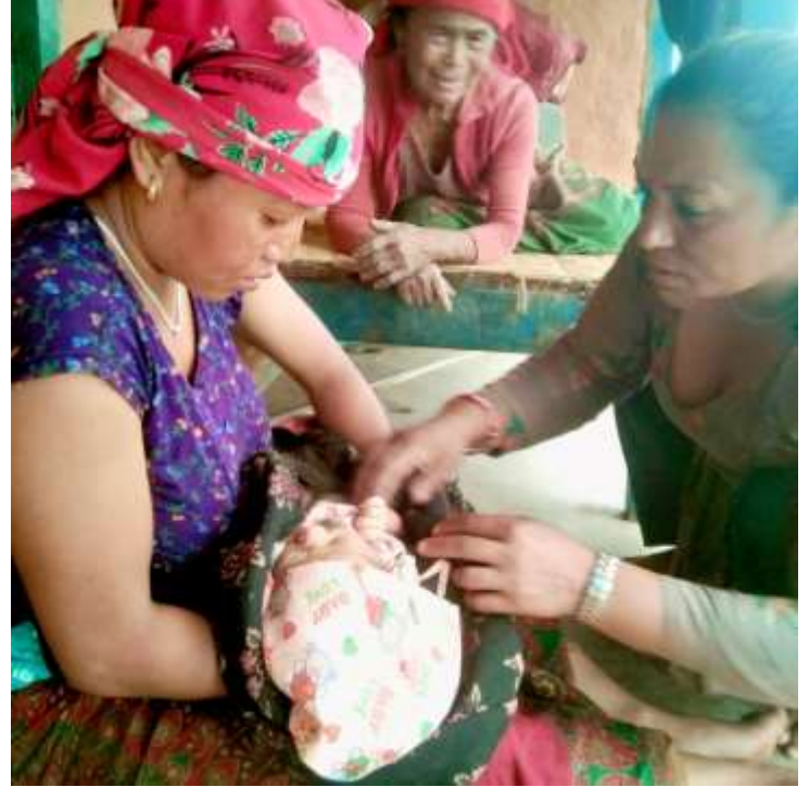
उत्तर प्रसुती घरभेट कार्यक्रम @ दगातुन्डाडा स्वास्थ्य चौकी, बागलुङ