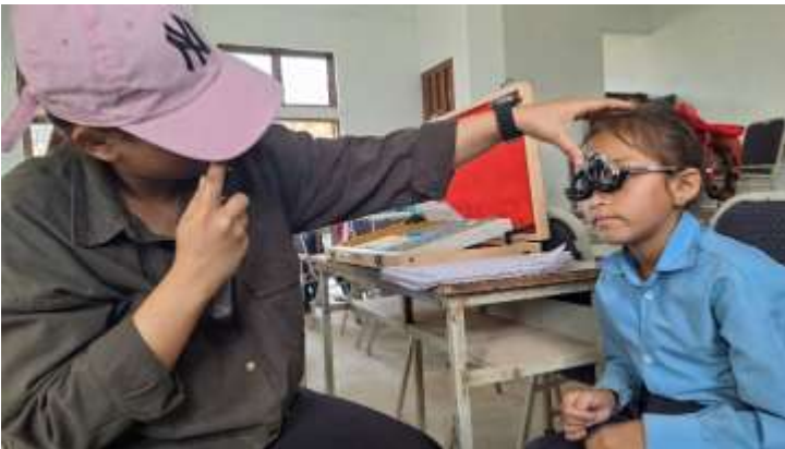
बोर्लाङ्ग स्वास्थ्य चौकी, गोरखाको आयोजनमा तथा भिमसेनथापा गाउँपालिका, स्वास्थ्य शाखा, गोरखा लायन्स आँखा सेवा केन्द्र, महादेवटार स्वास्थ्य सेवा केन्द्रको समन्वयमा विधार्थीहरुलाई स्कुलमै पुगेर नेत्र विशेषज्ञ र आँखा जाँच सेवा संचालन भएको छ।